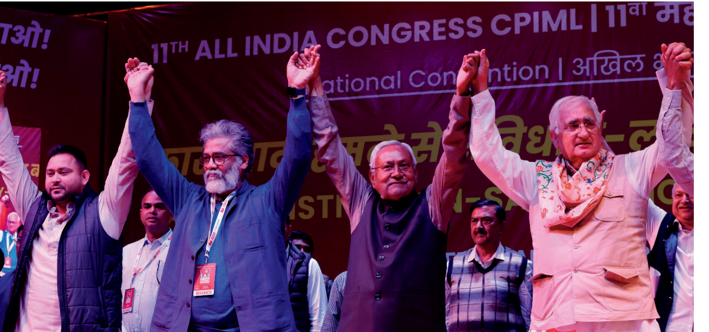
ದೇಶದ ವಿರೋಧ ಪಕ್ಷಗಳು ಐಕಮತ್ಯದಿಂದ ಸಂಘ ಪರಿವಾರದವರ ವಿರುದ್ಧ ಹೋರಾಡಬೇಕೆಂದು ನಡೆಸಿದ ಸಮ್ಮೇಳನ

ಪಕ್ಷದ ಹನ್ನೊಂದನೆಯ ಮಹಾಧಿವೇಶನವು ತನ್ನ ದೈಯೋದ್ದೇಶಗಳನ್ನು ಸ್ಪಷ್ಟವಾಗಿ ಗುರುತಿಸಿದ್ದು ಇವುಗಳನ್ನು ಸಾಕಾರಗೊಳಿಸಲು ಮುನ್ನಡೆದಿದೆ. ಈಗ ಇಡೀ ಪಕ್ಷವೇ ತನ್ನೆಲ್ಲಾ ಬಲವನ್ನೂ ಪ್ರಯೋಗಿಸಿ, ಪ್ರಜೆಗಳ ಪ್ರತಿರೋಧದ ಶಕ್ತಿಯನ್ನು ಬಳಸಿಕೊಂಡು, ಭಾರತದ ಕಮ್ಯುನಿಸ್ಟ್ ಚಳುವಳಿಯ ಭವ್ಯ ಪರಂಪರೆಯನ್ನು ಮೈಗೂಡಿಸಿಕೊಂಡು , ಭಾರತದ ಇತಿಹಾಸದಲ್ಲಿ ಕಾಣುವ ಎಲ್ಲ ಪ್ರಗತಿಪರ ಧೋರಣೆಗಳನ್ನೂ ಹೊತ್ತುಕೊಂಡು ಕ್ರಾಂತಿಕಾರಿ ಬದಲಾವಣೆಗಾಗಿ ಹೋರಾಡಲು ಸರ್ವಸನ್ನದ್ಧವಾಗಿದೆ. ★