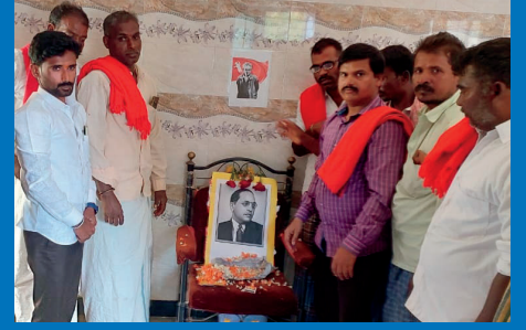
ಹರಪನಹಳ್ಳಿ, ಕೊಡಗು, ಎಚ್. ಡಿ. ಕೋಟೆ, ಬೆಂಗಳೂರು ಮತ್ತು ಇತರೆ ಜಾಗಗಳಲ್ಲಿ ಬಾಬಾಸಾಹೇಬ್ ಅಂಬೇಡ್ಕರ್ ಅವರ 132ನೇ ಜಯಂತಿ ಆಚರಿಸಲಾಯಿತು