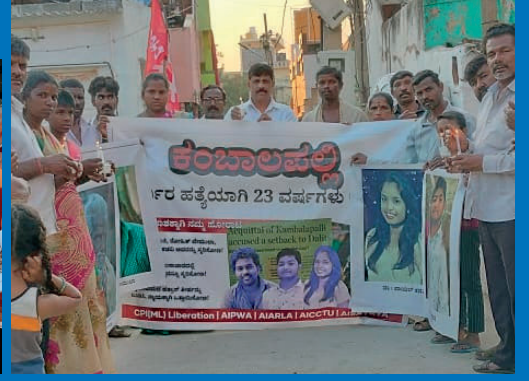
ದಿನಾಂಕ 11.03.2023ರಂದು ಚಿಕ್ಕಬಳ್ಳಾಪುರದ ಕಂಬಾಲಪಲ್ಲಿ ಹಳ್ಳಿಯಲ್ಲಿ ದಲಿತ ಸಮುದಾಯದವರ ಬರ್ಬರ ಹತ್ಯೆಯಾಗಿ 23 ವರ್ಷಗಳು ಕಳೆದಿದ್ದವು ಮತ್ತು ಅವರಿಗೆ ಶ್ರದ್ಧಾಂಜಲಿಯನ್ನು ಅರ್ಪಿಸಲಾಯಿತು