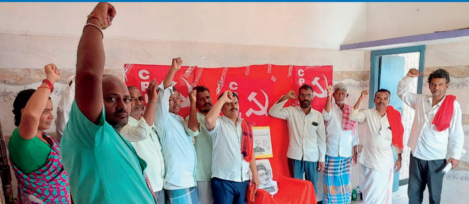
CPIML ಪಕ್ಷದ ಸಂಸ್ಥಾಪನಾ ದಿನವನ್ನು ಆಚರಿಸಲಾಯಿತು. ಕಾಮ್ರೇಡ್ ಲೆನಿನ್ ಮತ್ತು ಕಾಮ್ರೇಡ್ ಚಾರು ಮಜುಂದಾರ್ ಅವರನ್ನು ಸ್ಮರಿಸಲಾಯಿತು

EDITORIAL OFFICE: NO. 19, BHARAT BHAVAN, NO. 35, 1ST FLOOR, OPP. BALAJI PLYWOODS, INFANTRY ROAD, SHIVAJINAGAR, BANGALORE - 01.