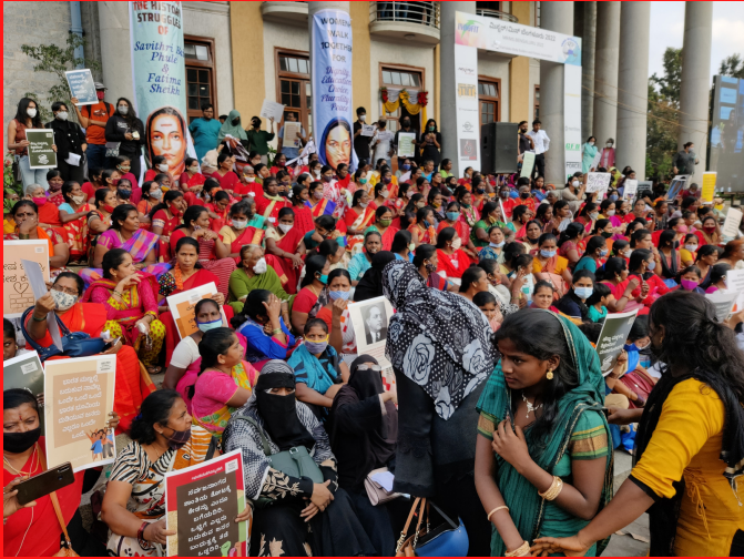
ಹಲವಾರು ಮಹಿಳಾ ಸಂಘಟನೆಗಳು ಒಗ್ಗೂಡಿ 'ಶಾಂತಿಗಾಗಿ ಮಹಿಳೆಯರು' ಎಂಬ ಹೋರಾಟವನ್ನು ಬೆಂಗಳೂರು ನಗರದಲ್ಲಿ ಹಮ್ಮಿಕೊಂಡಿದ್ದರು