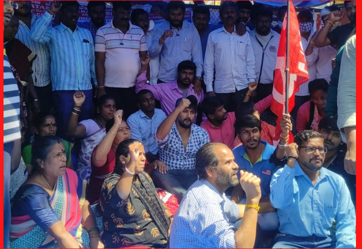
ಐಟಿಐ ಕಾರ್ಮಿಕರ ಹೋರಾಟಕ್ಕೆ ಬೆಂಬಲ ನೀಡಿದ್ದ ನಟ ಮತ್ತು ಸಾಮಾಜಿಕ ಕಾರ್ಯಕರ್ತ ಚೇತನ್ ಅಹಿಂಸಾ