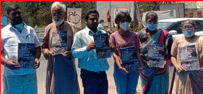
ಐಟಿಐ ಕಾರ್ಮಿಕರ ಹೋರಾಟ ಮತ್ತು ಅವರ ಕೆಲಸದ ಪರಿಸ್ಥಿತಿಯ ಕುರಿತು ಸಂಶೋಧಕರು ಮತ್ತು ಇತರರು ವರದಿಯನ್ನು ತಯಾರಿಸಿ ಅದನ್ನು ಬಿಡುಗಡೆ ಮಾಡಿದರು