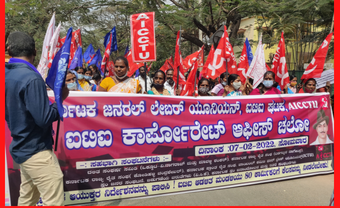
ಬೆಂಗಳೂರಿನಲ್ಲಿ 'ಐಟಿಐ ಕಾರ್ಪೊರೇಟ್ ಅಫೀಸ್ ಚಲೋ' ಕಾರ್ಯಕ್ರಮ