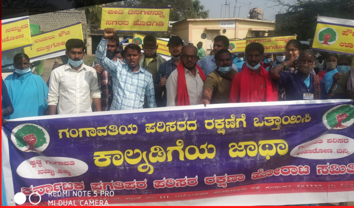
ಗಂಗಾವತಿ ಪುರಸಭೆಯಲ್ಲಿ ಪೌರಕಾರ್ಮಿಕರು ನಡೆಸಿದ ಪರಿಸರ ಸಂರಕ್ಷಣಾ ಹೋರಾಟ