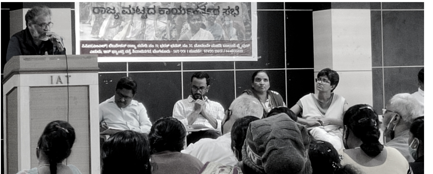
ಭಾರತದಲ್ಲಿ ಮೂಡುತ್ತಿರುವ ಫ್ಯಾಸಿವಾದವನ್ನು ತಡೆಗಟ್ಟಲು ಐಕ್ಯರಂಗವನ್ನು ರಚಿಸುವುದು ಅಗತ್ಯವಾಗಿದೆ ಎಂದು, ಕಾಂ. ದೀಪಾಂಕರ್ ಭಟ್ನಾಚಾರ್ಯ ಅವರು IIMS ಆಯೋಜಿಸಿದ್ದ ಕಾರ್ಯಕ್ರಮದಲ್ಲಿ ಮಾತನಾಡಿದರು