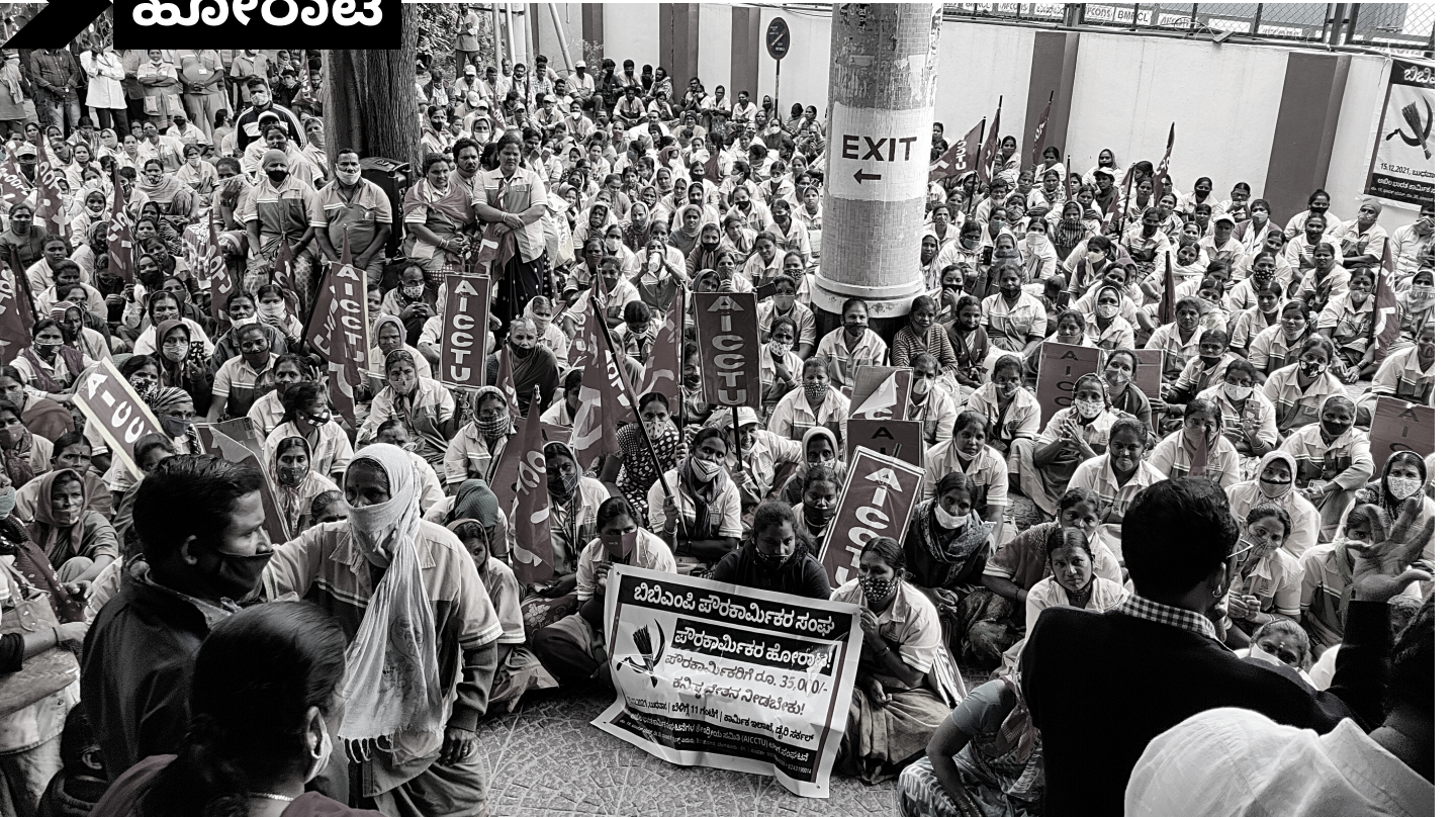
ಬಿಬಿಎಂಪಿ ಪೌರಕಾರ್ಮಿಕರ ಸಂಘವು ದಿನಾಂಕ 14.12.2021ರಂದು ಕಾರ್ಮಿಕ ಇಲಾಖೆ ಆವರಣದಲ್ಲಿ ಬೃಹತ್ ಪ್ರತಿಭಟನೆಯನ್ನು ಹಮ್ಮಿಕೊಂಡಿದ್ದು, ಕಾರ್ಮಿಕರು ತಮ್ಮ ಕನಿಷ್ಠ ವೇತನವನ್ನು ರೂ. 35,000/- ಕ್ಕೆ ಹೆಚ್ಚಳ ಮಾಡಬೇಕು ಎಂದು ಪ್ರತಿಭಟನೆಯನ್ನು ನಡೆಸಿದರು. *