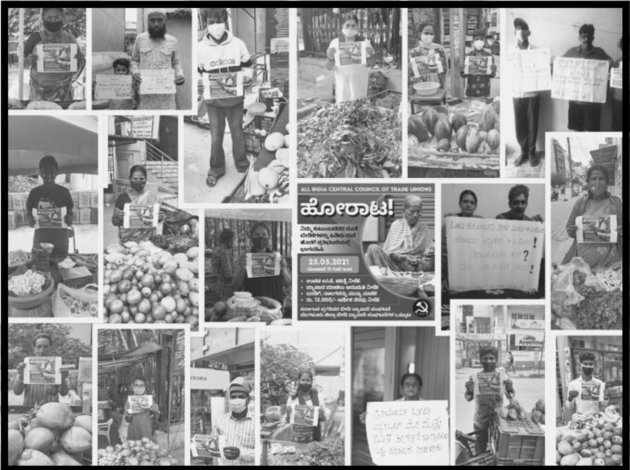
ಎಐಸಿಸಿಟಿಯು ಸಂಯೋಜಿತ ಬೀದಿ ವ್ಯಾಪಾರಿ ಸಂಘಟನೆಯ ಸದಸ್ಯರು ಕೊರೋನಾ ಕಾಲದಲ್ಲಿ ತಮ್ಮ ಜೀವನೋಪಾಯವನ್ನು ಉಳಿಸಲು ಮತ್ತು ಬೀದಿ ವ್ಯಾಪಾರಿಗಳ ಹಕ್ಕುಗಳಿಗಾಗಿ ಹೋರಾಟವನ್ನು ನಡೆಸಿದರು