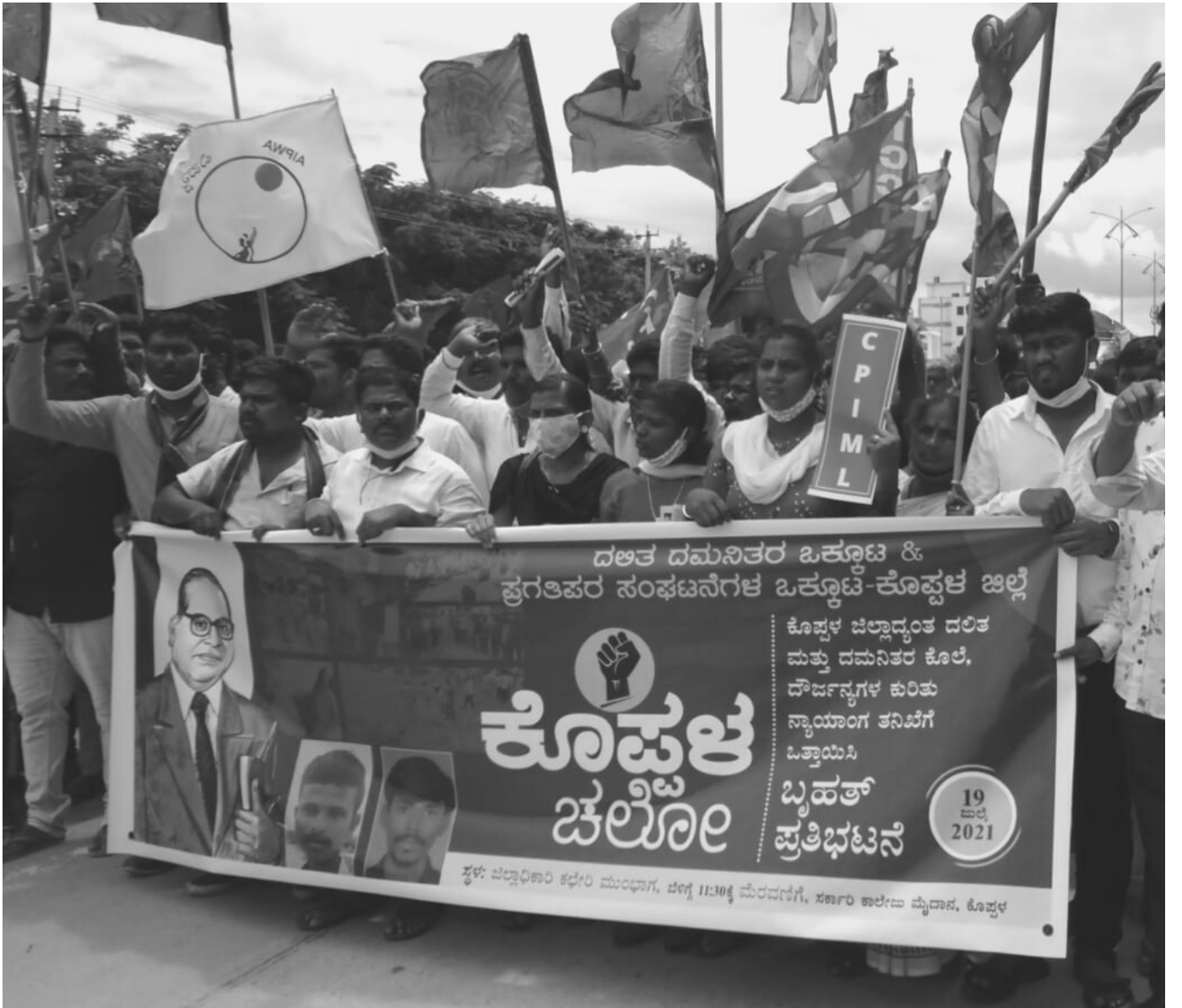
ಕೊಪ್ಪಳ ಜಿಲ್ಲೆಯಲ್ಲಿ ಹೆಚ್ಚುತ್ತಿರುವ ಜಾತಿ ದೌರ್ಜನ್ಯ ಮತ್ತು ಕೊಲೆ ಪ್ರಕರಣಗಳನ್ನು ತಡೆಗಟ್ಟಲು ಒತ್ತಾಯಿಸುತ್ತಾ 'ಕೊಪ್ಪಳ ಚಲೋ' ಕಾರ್ಯಕ್ರಮವನ್ನು ದಲಿತ-ದಮನಿತರ ಒಕ್ಕೂಟ ಮತ್ತು ಪ್ರಗತಿಪರ ಸಂಘಟನೆಗಳ ಒಕ್ಕೂಟದ ವತಿಯಿಂದ ಆಯೋಜಿಸಲಾಗಿತ್ತು